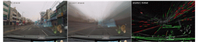
그림 1. 왼쪽:입력영상, 가운데:평균영상, 오른쪽:중심점 검출

이에 따라 본 논문은 해당 기법의 한계점을 극복한 평균영상(average image)의 특징으로 향상된 Hough 기법을 이용하여 블랙박스 카메라에 적합한 렌즈왜곡 보정 기법을 제안한다.