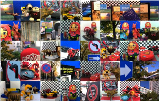
그림 2. Lytro 카메라로 취득한 영상

C 는 n \times m 크기의 회귀 계수 행렬을 의미하며, n 과 m 은 고해상도, 저해상도 패치의 픽셀의 개수를 의미한다. 또한 H 와 L 은 동일한 군집 내에 존재하는 고해상도, 저해상도 패치들로 구성된 행렬을 의미한다. 그림 1 에서 디서너리 훈련단계를 확인할 수 있다.